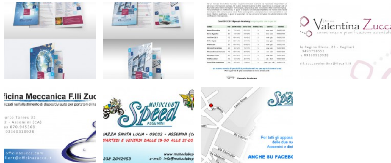
Photo editing and photomanipulation